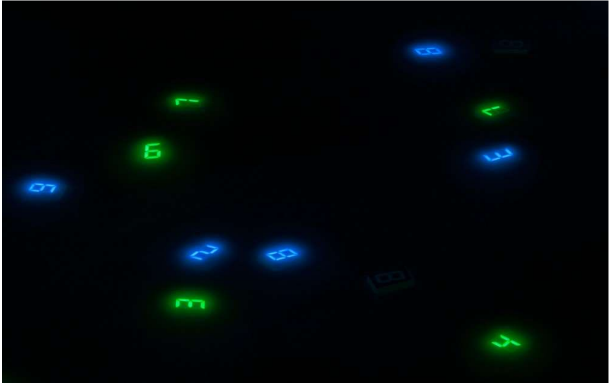
宮島達男「時の海-東北」プロジェクト(参考イメージ)

「それは変化し続ける」「それはあらゆるものとの関係を結ぶ」「それは永遠に続く」というコンセプトに基づき、生命の永遠性を象徴するデジタルカウンターの数字を用いて、生と死、命について表現し続ける宮島達男。「時の海 - 東北」プロジェクトでは、タイム設定ワークショップを通して、東北に想いを寄せる人々と出会い、それぞれの想いに耳を傾けながら、3,000名の人々の参加を目指して制作を進めています。この秋、当館において同ワークショップを開催する運びとなりました。併せて、これまでの参加者によって制作されたデジタルカウンターの一部を用いて「時の海 - 東北」のデモンストレーション展示を行います。