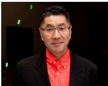
宮島達男 Miyajima Tatsuo

「それは変化し続ける」「それはあらゆるものとの関係を結ぶ」「それは永遠に続く」というコンセプトに基づき、生命の永遠性を象徴するデジタルカウンターの数字を用いて、生と死、命について表現し続ける宮島達男。「時の海 - 東北」プロジェクトでは、タイム設定ワークショップを通して、東北に想いを寄せる人々と出会い、それぞれの想いに耳を傾けながら、3,000名の人々の参加を目指して制作を進めています。この秋、当館において同ワークショップを開催する運びとなりました。併せて、これまでの参加者によって制作されたデジタルカウンターの一部を用いて「時の海 - 東北」のデモンストレーション展示を行います。