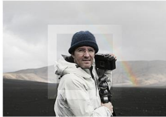
同じ現実、違う世界。あなたには何色に見えるだろうか？

ハラ ミュージアム アークでは、ニューヨークに突如巨大な滝を作ったことで知られるオラファー エリアソンのドキュメンタリー映画を特別上映します。エリアソンは2005年、原美術館での個展「オラファー エリアソン 影の光」の開催から、ハラ ミュージアム アークの常設作品「Sunspace for Shibukawa」の設置に至るまで、当館とも長年親交が深く、また21世紀の現代美術に最も影響を及ぼす一人として評されるアーティストです。この映画は、2008年に発表された巨大な滝のインスタレーション「ザ・ニューヨークシティ・ウオーターフォールズ」の制作過程を中心に、金沢21世紀美術館の展覧作品や、ドイツ・ベルリンにあるスタジオでの貴重な制作風景を撮影、エリアソンの創作現場に迫る内容です。群馬では初めての上映となります。