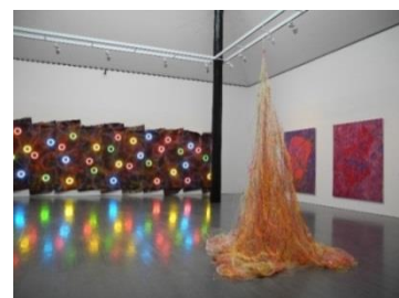
4. 「Multiple Star II」展示風景