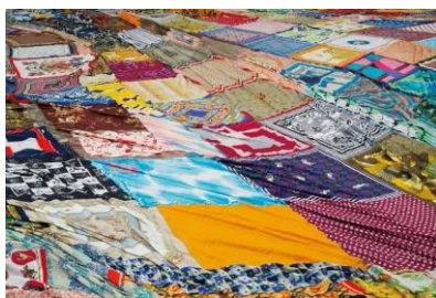
2. 「Multiple Star III」(部分イメージ)

本年、通年企画として継続中の「鬼頭健吾 Multiple Star」展、第三弾を開催いたします。春の第一期では、1300本のフラフープを素材とした展示室を埋め尽くす伸びやかでカラフルな大型インスタレーションによって、夏の第二期では、新作中心の気迫に満ちた作品群が醸し出す緊張感のある会場構成によって見るものを魅了しました。このたびの第三期では、これまで鬼頭が手がけてきたモチーフと新たなそれが重なり合い共振する、新作インスタレーションが出現します。40歳を迎えた鬼頭のこれまでの創作活動の集大成となる本展、どうぞお見逃しなく！