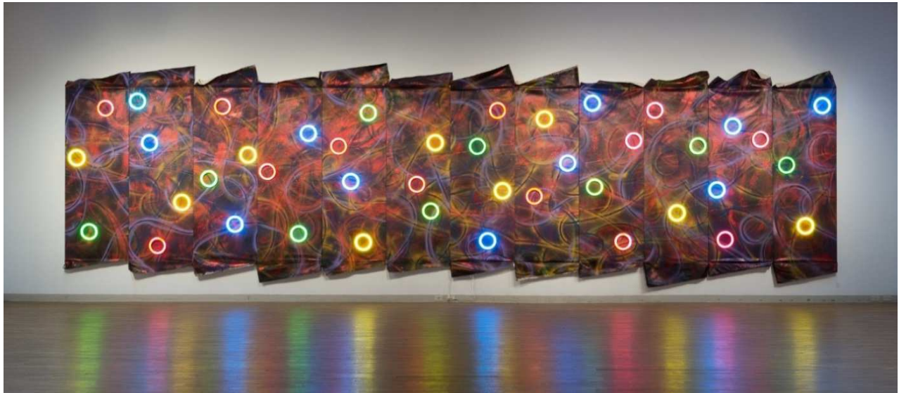
鬼頭健吾「Interstellar」2016年

2017年7月1日[土]ー9月10日[日] ハラ ミュージアム アーク 現代美術ギャラリーA