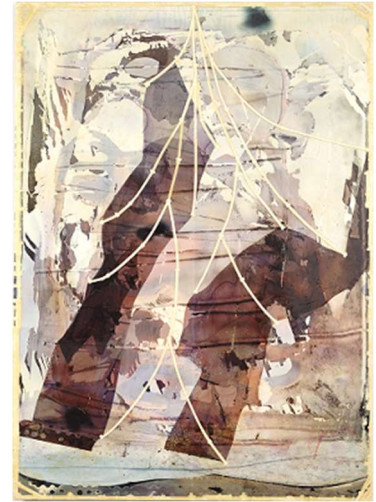
3 大竹伸朗「網膜 #2 (紫影)」1988-90年 ©Shinro Ohtake