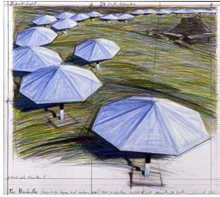
2 クリスト「アンブレラ、日本とアメリカ合衆国の ジョイントプロジェクト」1986年 ©Christo