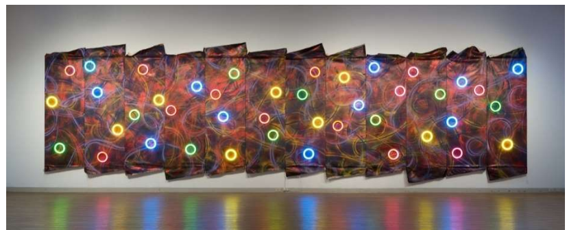
5 鬼頭健吾「Interstellar」2016年 撮影 大河原光 ©Kengo Kito