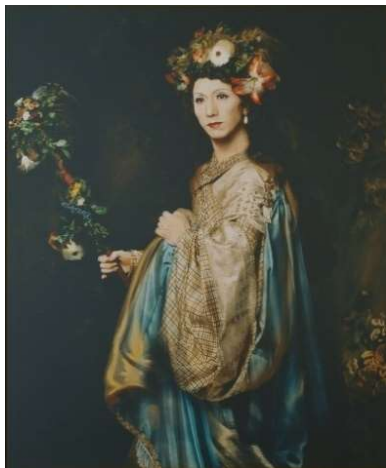
4 森村泰昌「家族の肖像・妻」1994年 ©Yasumasa Morimura