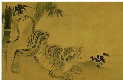
2 狩野探幽「龍虎図」江戸時代【後期】