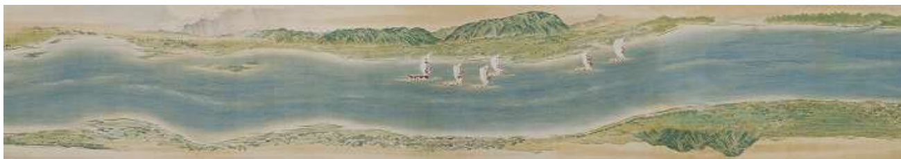
1 円山応挙「淀川両岸図巻」江戸時代（部分）

本展では、桃山から江戸時代に活躍した三人の画人の作品を中心にご紹介いたします。桃山時代、大画面の襖絵など勇壮な障屏画を数多く手掛けた狩野永徳（1543-90年）と、その孫で徳川幕府の御用絵師となった狩野探幽（1602-74年）による水墨画の競演と、狩野派とは一線を画し、自らの眼で確かめた風景や人物を写すことに徹して日本写生画の祖とされた円山応挙（1733-95年）による鮮やかな彩色の「淀川両岸図巻」を、下図と合わせご鑑賞ください。