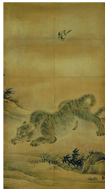
3 狩野永徳「虎図」（三井寺旧日光院客殿障壁画）桃山時代（部分）【前期】