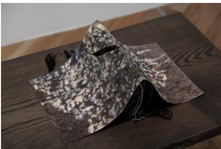
ムナム アパン 「ヒルサイド・ストーリーズ:影を運ぶ犬ーハチ公の記憶」 2008 年 綿糸、糊、紙、タモ材台座 26 x 56 x 15 cm(作品)、52 x 90 x 40 cm(台座) (部分) 個人蔵