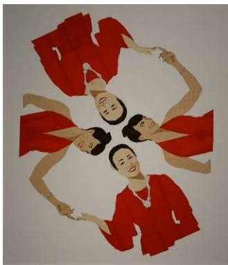
メアリー=エリザベス ヤーボロー 「お目にかかれて嬉しいです」 2007 年 ダクトテープ、コンタクトペーパー 63×55 cm