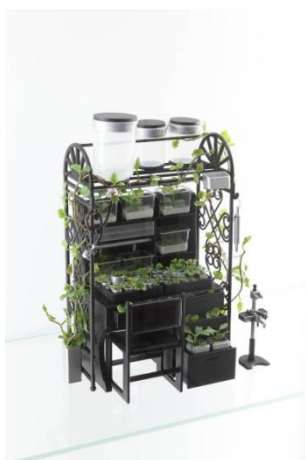
ドナ オン 「秘めたる、静かなる場所で (iv)」 エナメル絵具、ミニチュアプラスチック玩具、プラスチック製品 2008年 20 x 13 x 27 cm 個人蔵