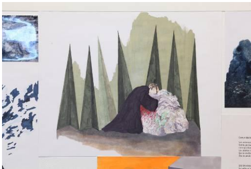
フロレンシア ロドリゲス ヒレス 「フィクショナル アイランズ」