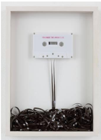
デュートハルドーノ 「無題(それは、B 面だよ)」