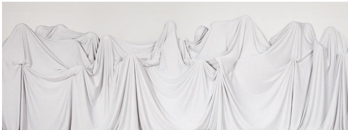
シャギニ ラトナウラン 「L.S.」 2011 年 写真(インクジェットプリント) 57.2 x 150.3 cm

インドネシア、シンガポール、インド、アフガニスタン、ブラジル、アルゼンチンそしてアメリカ— さまざまな場所から集うアーティストが美術館に創る「共生」の場