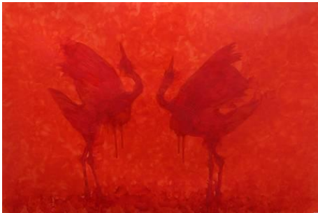
プラディーブ ミシュラ 「ウォームス オブ トゥゲザネス(9)」 2010 年 油絵具、キャンバス 138 x 209 cm