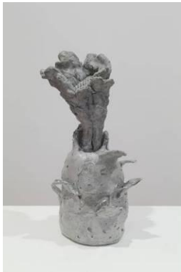
エリカ ヴェルズッティ 「カルボナーダ」 2010 年 コンクリート、ガラスビーズ 32 x 13 x 13 cm