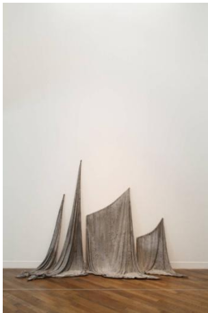
チアゴ ホシャ ピッタ 「地質大陸移動の記念碑」 2012 年 布、セメント 260 x 58 x 177cm