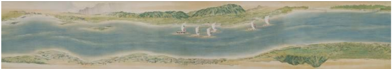
円山応挙「淀川両岸図巻」一卷(部分) 江戸時代 明和2年(1765)

日本人が育んできた季節や時の移ろいへの鋭敏な感覚を、さまざまな美術表現を通してお楽しみください。